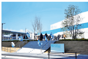
開空アイスアリーナ