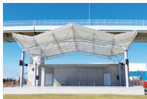
りんくう野外文化音楽堂