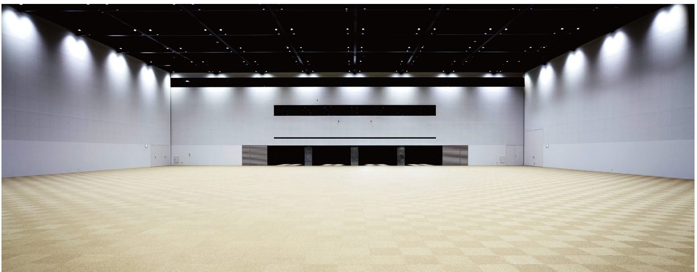
ニューホール内 New Hall Interior