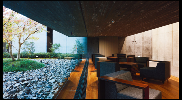
ホワイエ奥のラウンジ空間 Lounge in the rear of the foyer

The interior, furnishings, and accessories in the foyer and anterooms make sumptuous use of traditional Kyoto crafts that convey “beauty, skill, and spirit.”