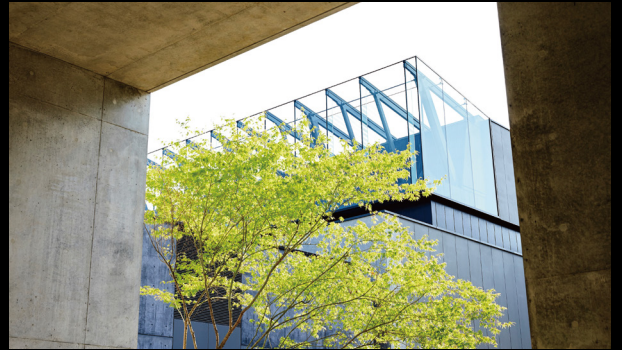
ガラス屋根 Glass Roofs

The roof's glass section features a transparent architectural design that blends into the surrounding area and natural environment. Environmental impact is minimized with green technologies and design approaches such as a highly efficient exhaust system and solar panels integrated into the glass.