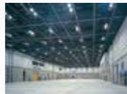
展示イベントホール