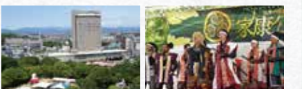
出世の街家康祭り・家康楽市 in 浜松出世城