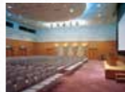
コンGRESSセンター41会議室