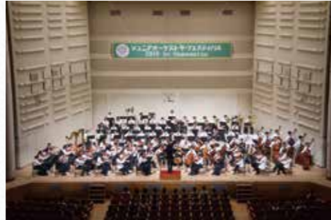
ジュニアオーケストラフェスティバル in Hamamatsu

「アクトシティ浜松」は、東海道新幹線/東海道本線のJR浜松駅から徒歩3分。ヒト、モノ、情報が集積する浜松の中心に位置しています。浜松市と民間の施設からなる複合施設で、大・中ホールやコンGRESSセンター、オークラクトシティホテル浜松、専門店街のあるアクトタワー、展示イベントホール、楽器博物館、研修交流センター、オフィス等で構成されています。国際会議から大規模な展示会まで、あらゆるニーズに対応できる施設です。