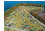
ジャパンミニディin浜名湖