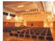
研修交流センター