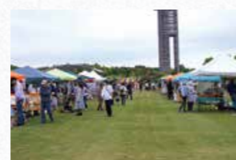
わくわくクラフト2Days