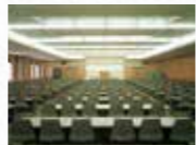
コンGRESSセンター31会議室