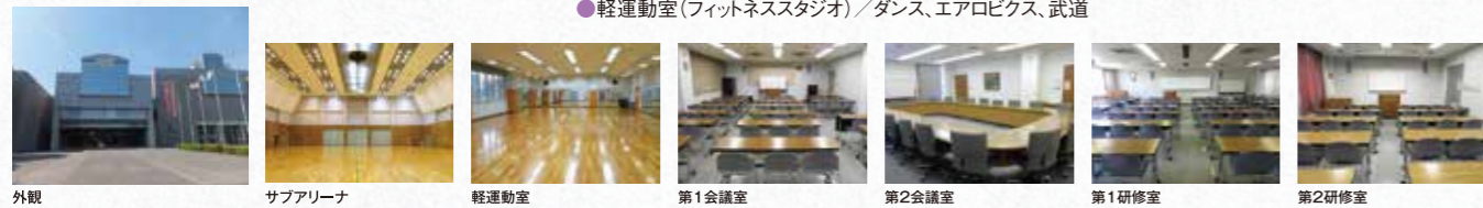
外観 サブアリーナ 軽運動室 第1会議室 第2会議室 第1研修室 第2研修室