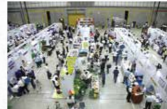
ビジネスマッチングフェア in Hamamatsu