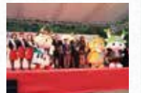
ゆるキャラグランプリ