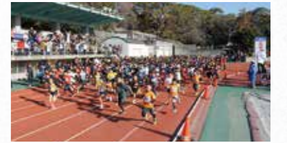
浜松シティマラソン