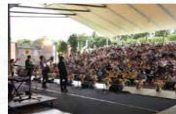
浜名湖フォークジャンボリー