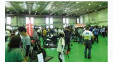
バイクのふるさと浜松