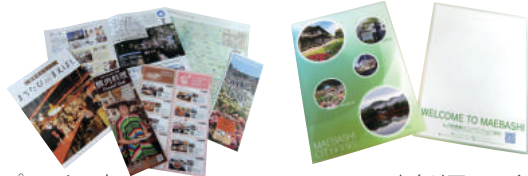
▲観光パンフレット