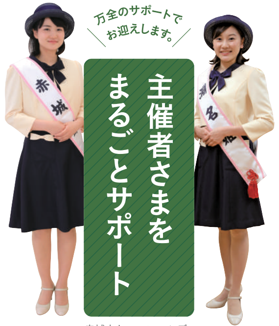
赤城山キャンペーンレディ 「赤城姫・淵名姫」