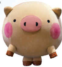
「TONTONのまち前橋」のキャラクター「ころとん」

「TONTONのまち前橋」のキャラクター「ころとん」や「赤城姫・淵名姫」、「ローズクイーン」の派遣手続きのお手伝いをいたします。