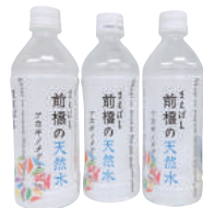
◀前橋の天然水 アカギノメグミ

前橋の観光パンフレットや、「前橋の天然水 アカギノメグミ」(500ml)や協会オリジナルファイルなどのノベルティ類の提供をおこないます。