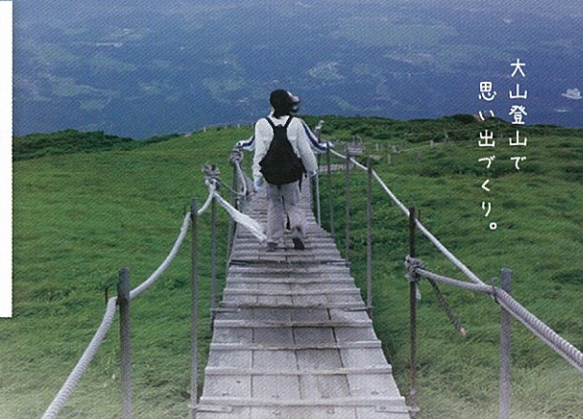
大山登山で 思い出づくり。