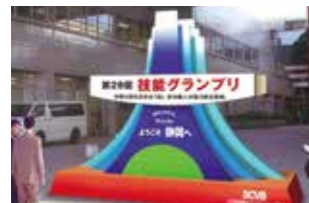
Aタイプ/高さ3.5m × 幅5.0m