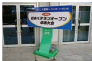
Cタイプ/高さ1.8m × 幅1.8m