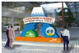
Bタイプ/高さ3.7m × 幅5.0m