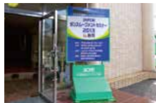
Dタイプ/高さ2.4m × 幅1.2m