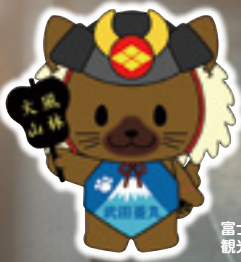
富士の国やまなし 観光キャラバン隊長「武田菱丸」