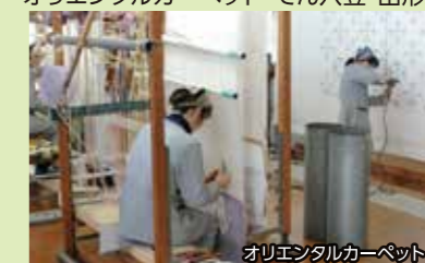
オリエンタルカーペット