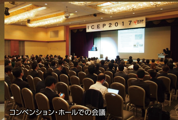
コンベンション・ホールでの会議