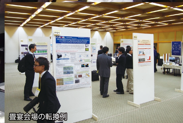
畳宴会場の転換例