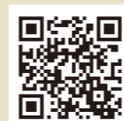
支援内容のご案内