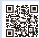
宿泊施設のご案内

一般的な温泉ホテルの料金プランは、1泊2食付です。しかし、国際会議などコンベンションの場合、参加者が申込み宿泊プランを1泊朝食付きで対応出来るホテルもございます。また、地域によっては、温泉ホテルから徒歩圏にビジネスホテルがあり、参加者は選択の幅が広がります。これにより、主催者様は通常のホテルや公的施設を会場に企画する場合と同じようにコンベンションを企画する事が出来ます。また、温泉ホテルでもベッドインの部屋(和洋室)や洋室があり、平日や季節によっては安価にシングルユースが出来る時期もございます。他人と一緒にの大浴場が苦手な方には、部屋に風呂が付いた部屋がございます。