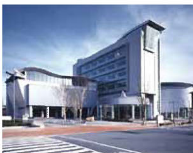
米子コンベンションセンター

公益財団法人とっとりコンベンションビューローは、鳥取県のコンベンション振興を図るため、鳥取県、県内市町村、その他多数の団体、企業の支援により設立された公益法人です 私たちは、鳥取県の有する優れた自然、歴史的・文化的資源を活かし、コンベンションの誘致、支援等を行うことにより、県内産業の振興、地域の活性化、国際的な相互理解の増進及び文化の向上に寄与することを目的とし活動しています。