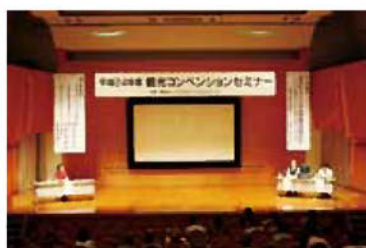
コンベンションセミナー