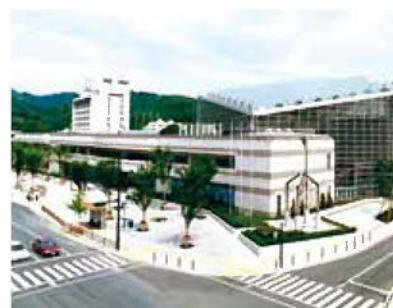
とりぎん文化会館(鳥取県民文化会館)