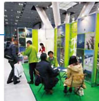
コンベンションの誘致活動

県内外の団体、大学、企業等に対して、鳥取県でのコンベンション開催を提案し誘致を推進しています。また、開催決定したコンベンションには、会場の手配や関連業者の紹介、開催助成金やボランティア制度等による様々な支援を行っています。