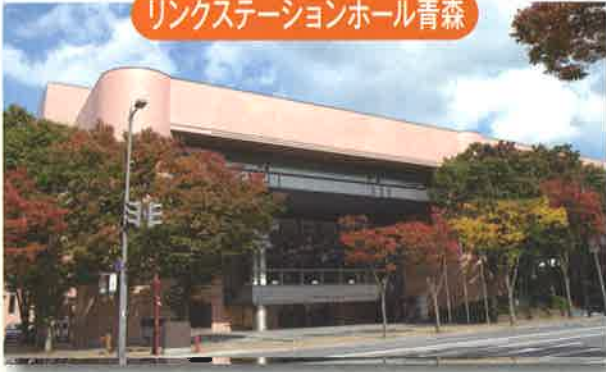
リンクステーションホール青森