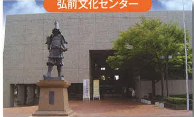
弘前文化センター